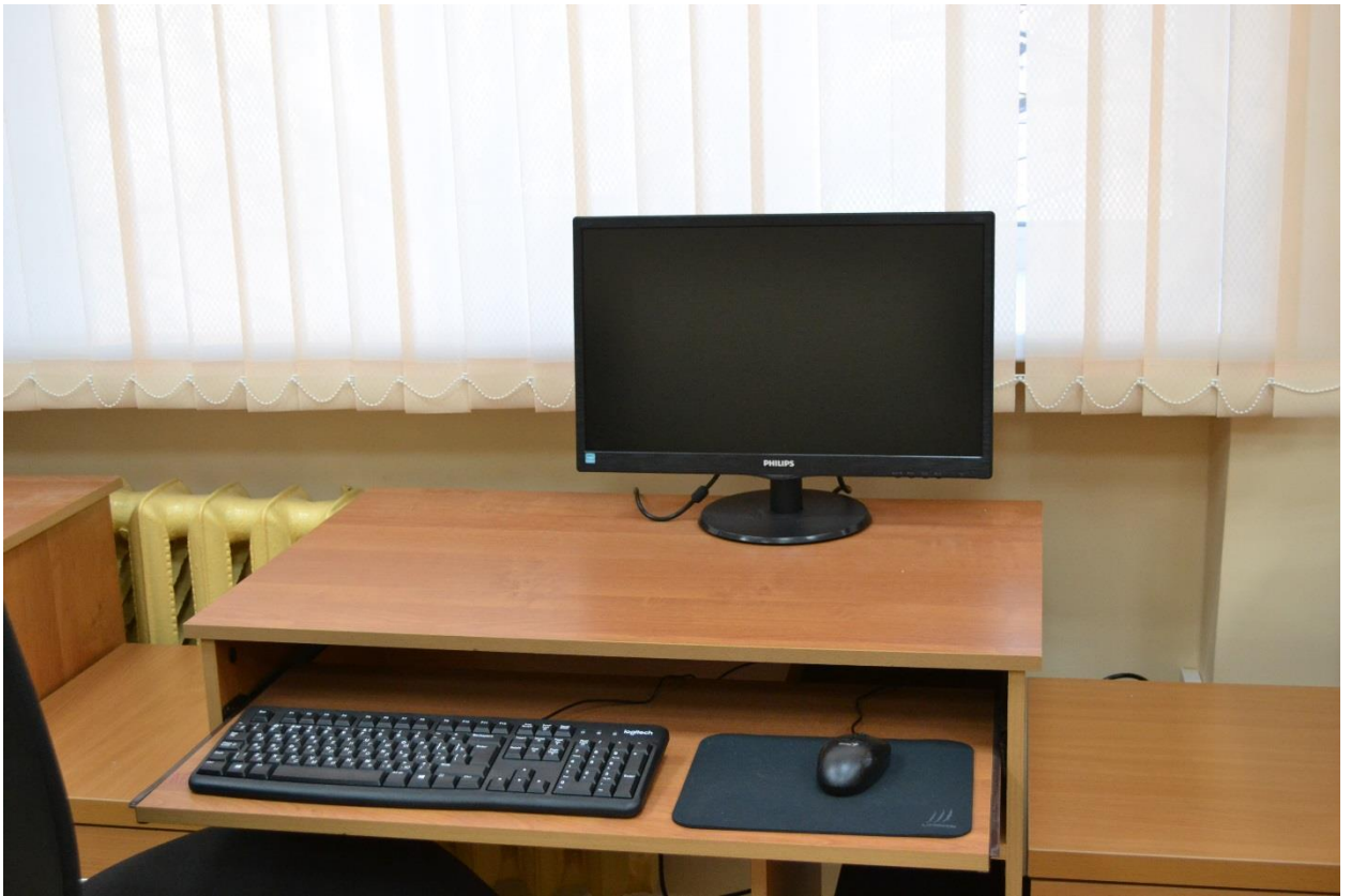
Мультифункциональный компьютерный Кабинет оборудован стационарной звукоусиливающей аппаратурой