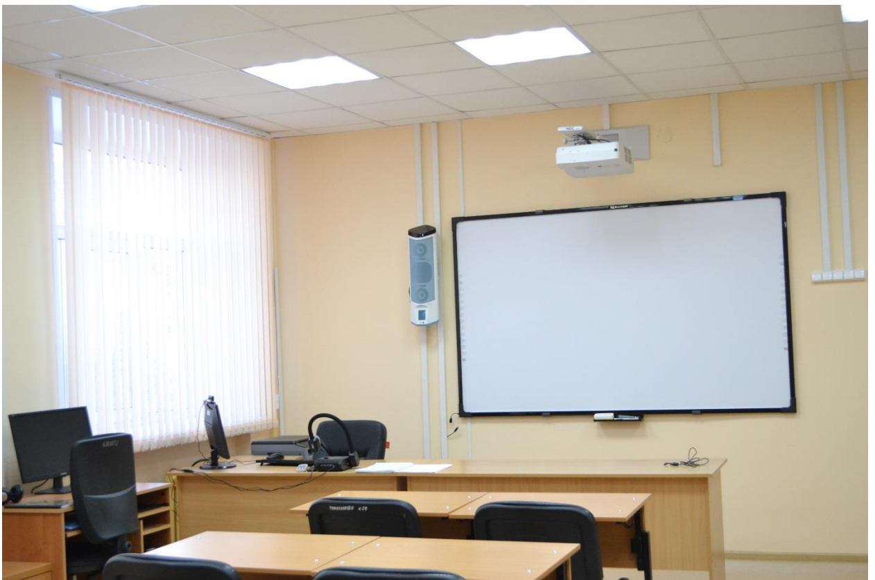
Общий вид мультифункционального компьютерного кабинета