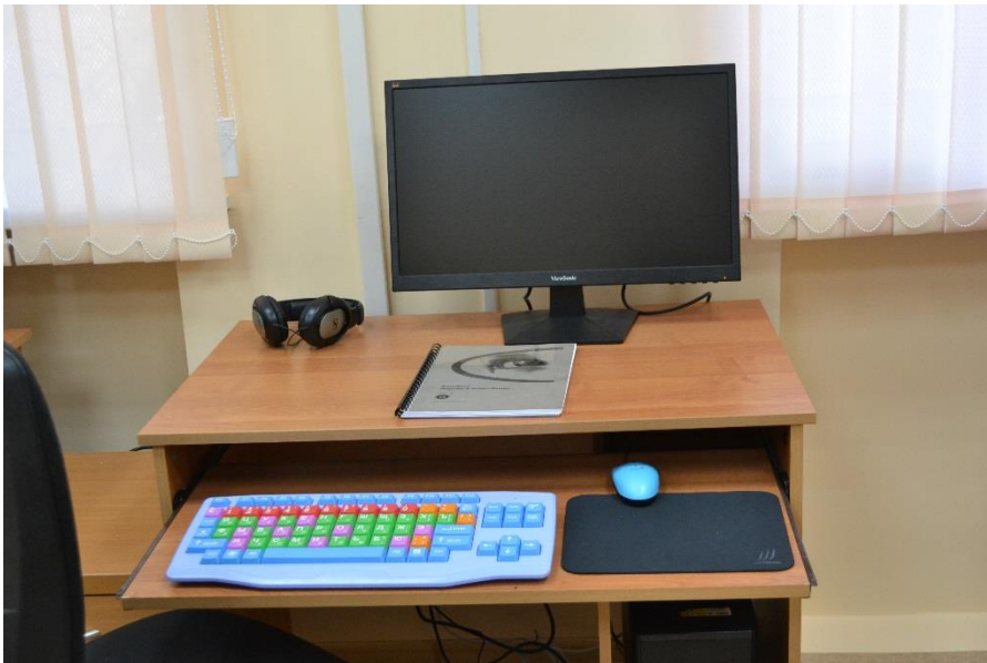
Рабочее место для пользователя с нарушениями опорно- двигательного аппарата